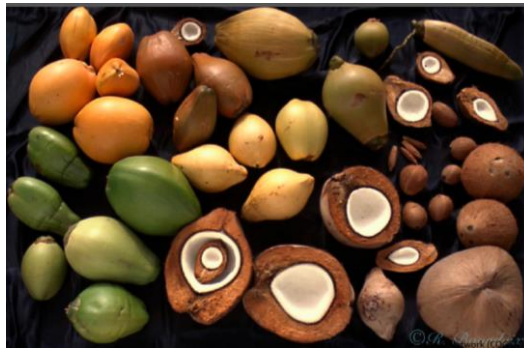
สายพันธุ์มะพร้าวทั่วโลก

มะพร้าวเป็นพืชที่มีเพียงสปีชีส์เดียว แต่มีความหลากหลายของสายพันธุ์ แต่ละสายพันธุ์จะมีรูปร่างหน้าตาที่แตกต่างกันไป มีทั้งสีเหลือง สีเขียว สีน้ำตาล รวมถึงขนาดรูปทรงของลูกมะพร้าวก็แตกต่างกัน