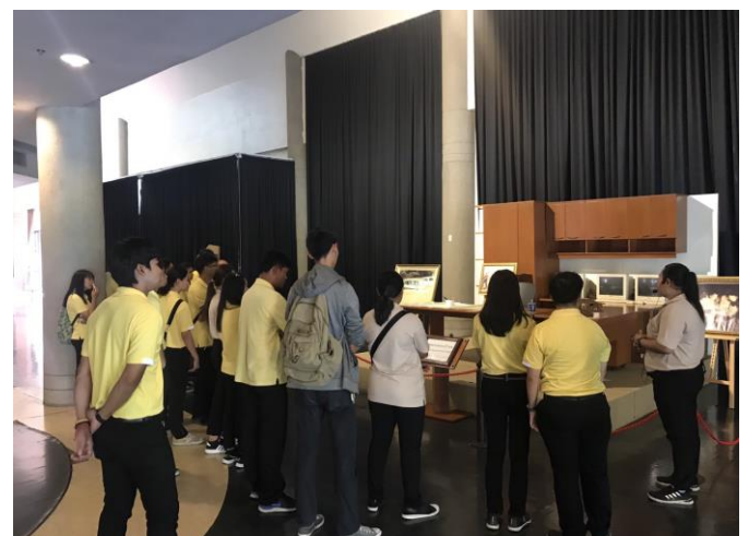
ชมพิพิธภัณฑ์ภายในและภายนอกอาคาร