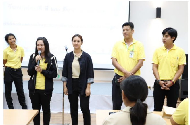
ปฐมนิเทศและแนะนำเจ้าหน้าที่