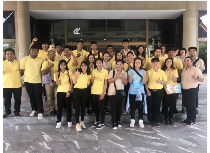
ชมพิพิธภัณฑ์ภายในและภายนอกอาคาร