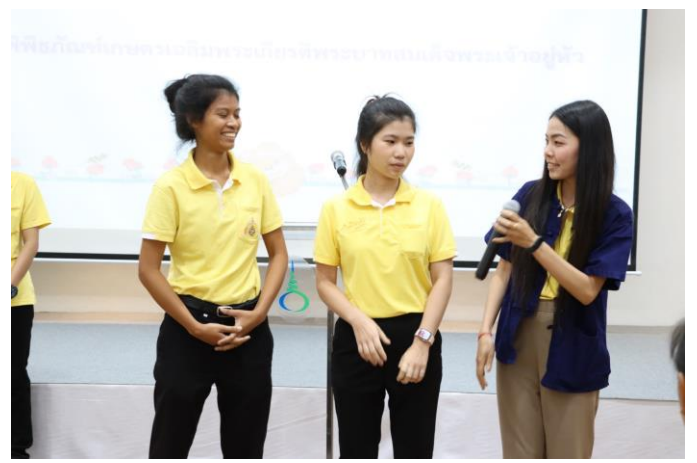
ปฐมนิเทศและแนะนำเจ้าหน้าที่