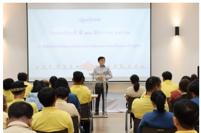
ผู้อำนวยการ พกฉ. มอบนโยบาย